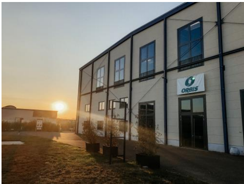
Bild 2: Standort der ORBIS GmbH in Hürth bei Köln