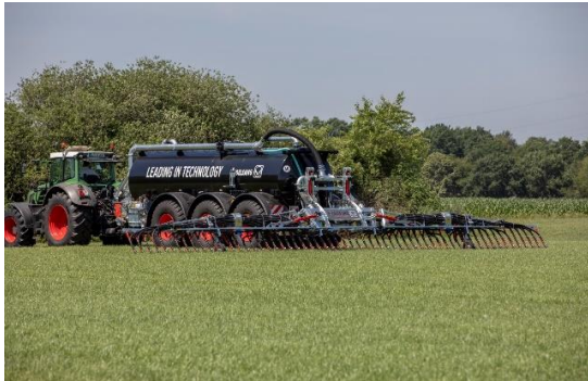
Bild 1: Präzise Gülleausbringung mit dem Schleppschuhgestänge BlackBird, hier auf einer Arbeitsbreite von 15 Metern.