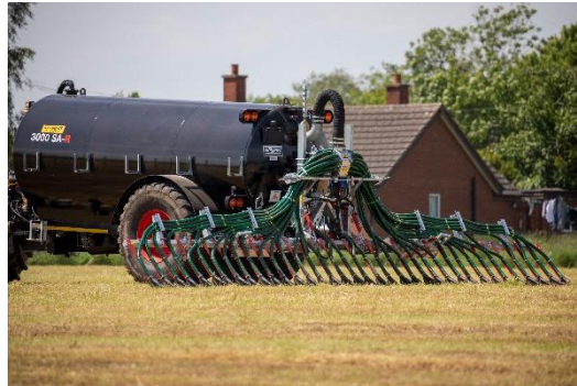
Bild 2: Das Universalgestänge UniSpread ist durch seine kompakte Bauweise und flexibel wählbare Ausbringtechnik vielfältig einsetzbar.