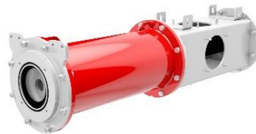
Bild 4: Die Exzentrerschneckenpumpe ProCap T ist besonders kompakt gebaut.