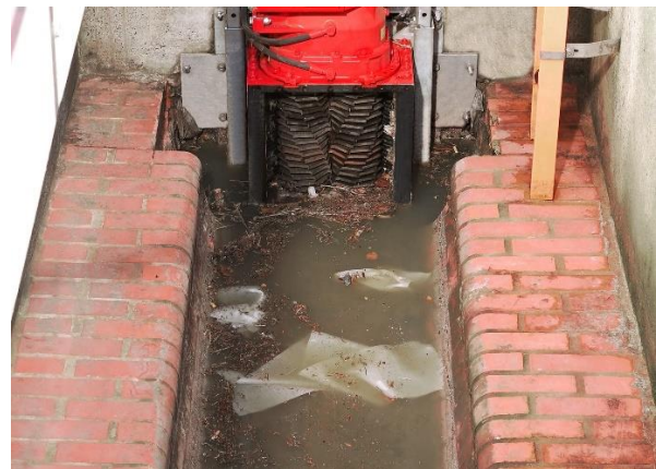
Bild 4: Die Ripper-Rotoren zerkleinern Störstoffe im Abwasser und schützen so die nachgeschalteten Pumpen und Armaturen.