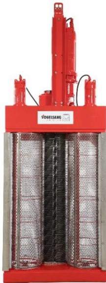
Bild 1: Der weiterentwickelte XRipper XRG186 für große Kanäle und hohe Durchflussmengen.