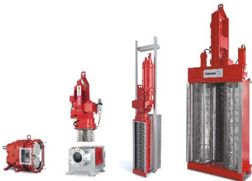
Bild 1: Die Webinar-Reihe von Vogelsang gibt einen Überblick über Bauarten, Funktionsweise und Einsatzgebiete der XRipper-Abwasser-Zerkleinerer in der Kanalisation.